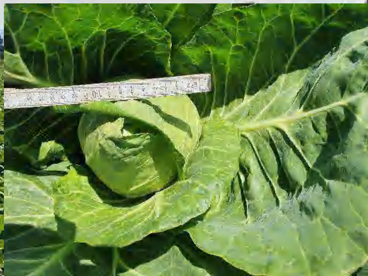
Stig Arild Oldervik, Frosta 17.06.20