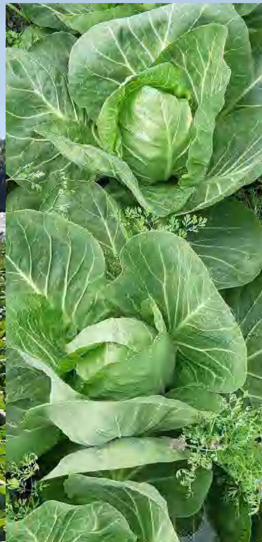
Egil Minde, Frosta 16.06.20