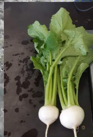
Roar Vold, Frosta 17.06.20